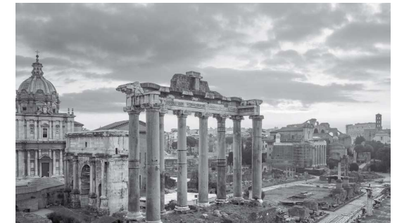
Templo de Saturno en el Foro Romano, Roma, Italia

En el año 336 d.C., el emperador Constantino I, quien había oficializado y universalizado el cristianismo en el Imperio Romano, designó a la Navidad como fiesta estatal el 25 de Diciembre. El Papa Julio I pidió que el nacimiento de Cristo se celebrara en la misma fecha.