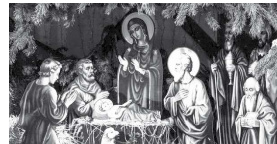
La Navidad celebra el nacimiento de Jesucristo

La Saturnalia era otra festividad que se realizaba entre el 17 y el 23 de diciembre y honraba al dios agrícola Saturno en una fiesta que se celebraba en su Templo, en el Foro Romano, donde ya se intercambiaban regalos.